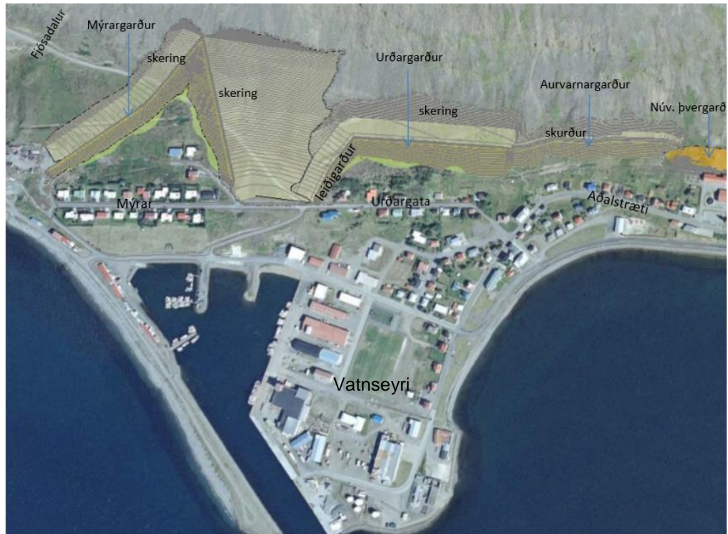
Mynd 4.2 Yfirlitsmynd þar sem ofanflóðagarðar eru merktir inn (Landmótun, 2016)