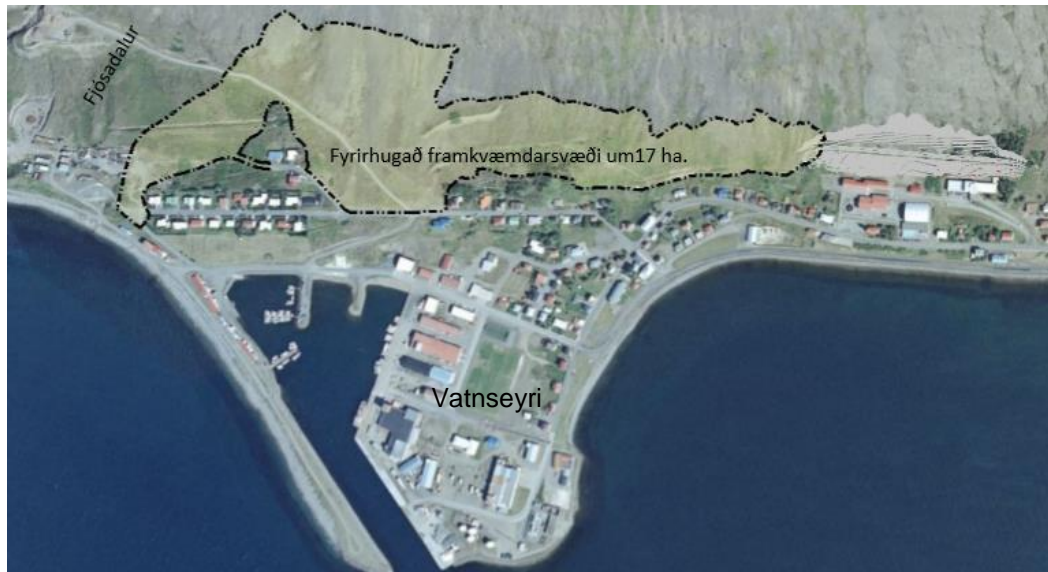
Mynd 4.1 Yfirlitsmynd sem sýnir afmörkun framkvæmdarsvæðið (Landmótun, 2016)

Annar varnargarðurinn, Mýrargarður, myndar fleyg fyrir ofan Hóla og Mýrar meðan hinn varnargarðurinn, Urðargarður, verður samtengdur þvergarður og leiðigarður og mun liggja fyrir ofan Urðargötu (mynd 4.2). Mýrargarður verður 590 m langur og 5-11 m hár yfir núverandi landi. Urðargarður verður um 370 m langur og verður tvískiptur. Eystri hlutinn verður 250 þvergarður ætlaður til að stöðva snjóflóð meðan vesturhluti garðsins verður um 125 m langur leiðigarður sem hefur þann tilgang að beina snjóflóðum út í sjó. Urðargarður verður allt að 7,5-11 m hár yfir núverandi landi. Við enda Urðargarðs, fyrir ofan Aðalstræti, er vatnsrás en í tillögu Landmótunar er lagt til að vatnsrásin verði víkkuð og bakki hækkaður til að taka á móti og stöðva grjót og hugsanlegt aurflóð úr hliðunum (Landmótun, 2016).